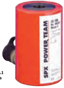
ASME B30.1 700 bares

10, 20, 100 toneladas Los modelos de acción simple incluyen un collar liso