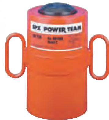
Los modelos de doble acción de 30, 60, 100 toneladas disponen de collar roscado