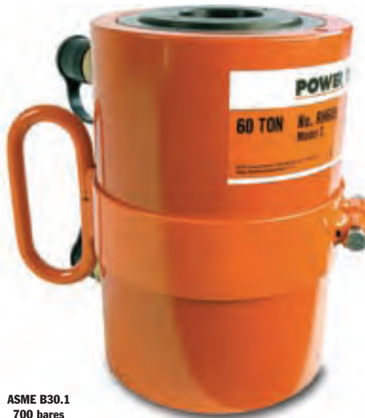
ASME B30.1 700 bares